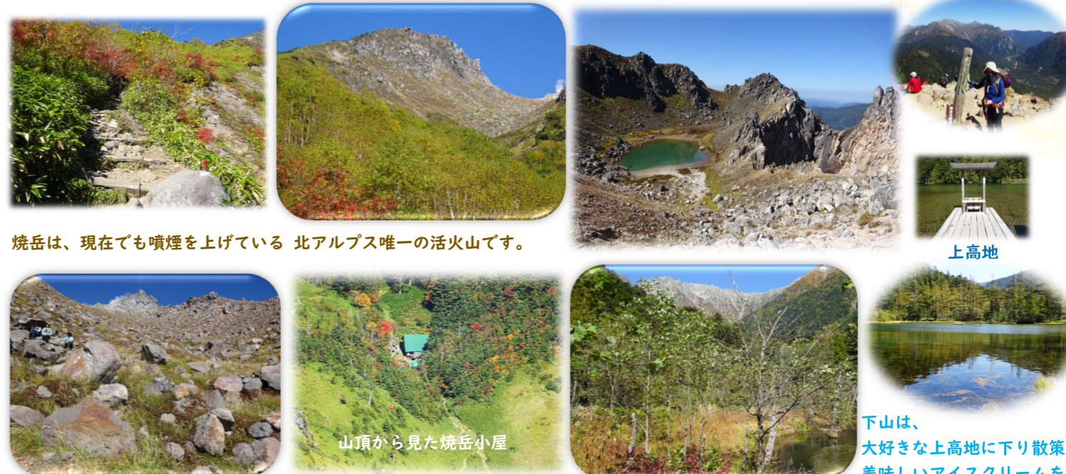
焼岳は、現在でも噴煙を上げている北アルプス唯一の活火山です。