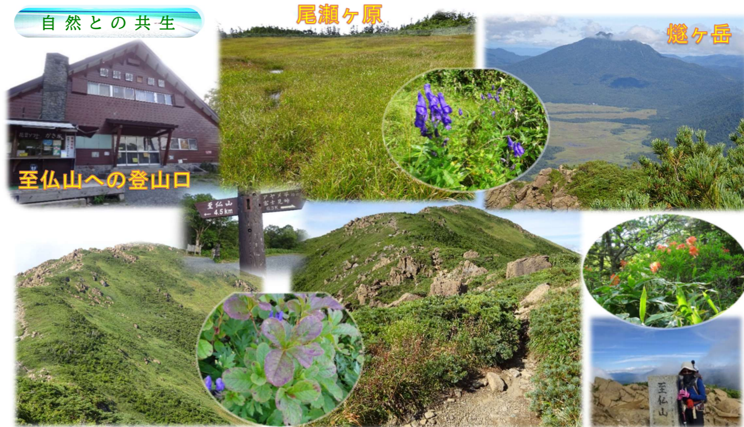
至仏山への登山口