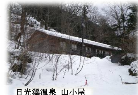
日光澤温泉 山小屋