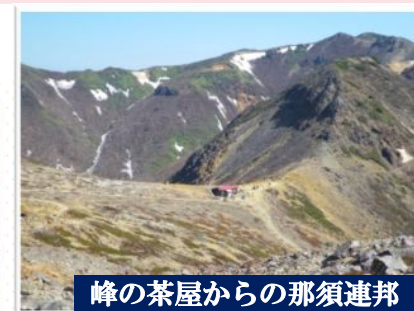
峰の茶屋からの那須連邦